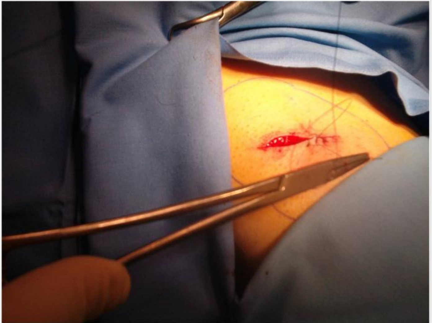
sutura con punti staccati dopo biopsia

E' l'asportazione di cute in anestesia per contatto o per infiltrazione a scopo diagnostico (esame istologico). E' importante che il patologo abbia dimestichezza con la dermatologia per poter "dialogare" con il dermatologo e giungere ad una diagnosi istologica ragionata e orientativa per il clinico.